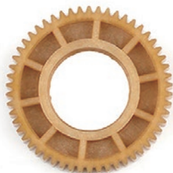
AS71216 アイドラギヤ 54T 【3ギヤボックス用/B7/T7/SC7】